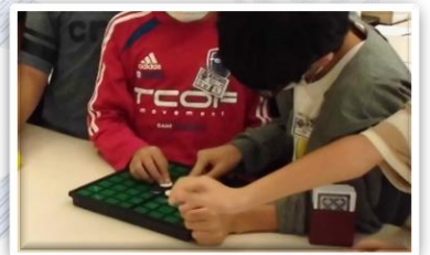
オセロもマス目に凸線、 コマも黒に凸があるよ。

コロナ禍でも何かボランティアしたい!と思っているみなさん ボランティア活動には大きくわけて10分野あります。 その3