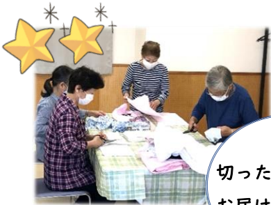
切った布は施設へ お届けします。