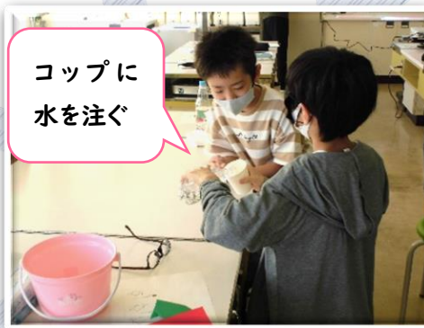
コップに 水を注ぐ