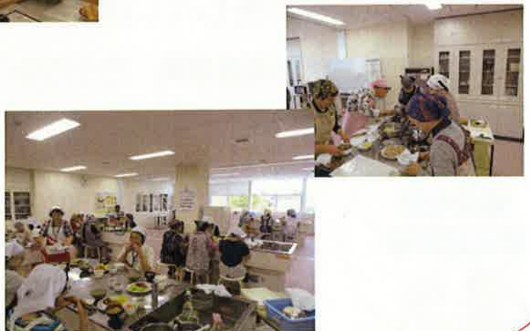
普及講習会の様子